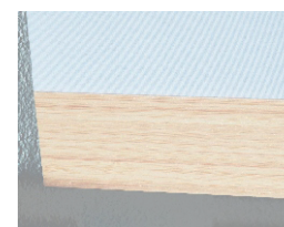
Avslut med trälamell.