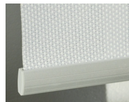
Avslut med 20mm aluminiumlist.